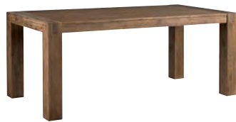
Smoke White Brushed