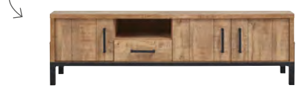
TV-meubel 3 deuren, 1 lade, 1 vak H53xB176xD45 10364620 Maat open vak: H16xB42xD45