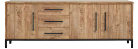
Dressoir 3 deuren, 3 laden H87xB240xD45 10364618