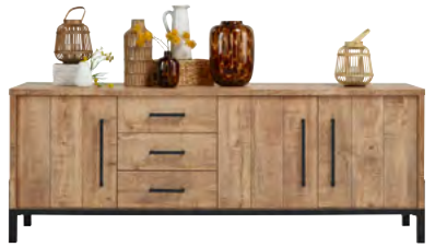
Dressoir 3 deuren, 3 laden H78xB208xD45 10364617